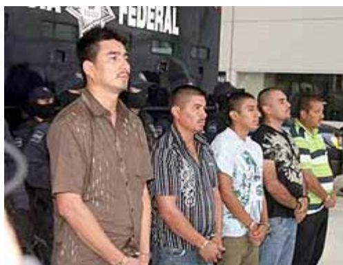
Fueron capturados miembros del cártel del Pacífico; uno de ellos pretendía atentar contra Felipe Calderón.

MÉXICO - Las autoridades mexicanas informaron este lunes de la detención de un presunto operador financiero del cártel de las drogas del Pacífico que presuntamente tenía planeado atentar contra el presidente de México, Felipe Calderón.